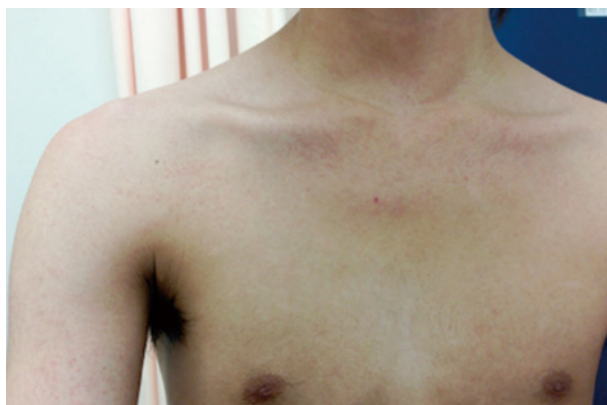
写真 1. 風疹による発疹（成人）。

風疹は 21 日間の潜伏期間（感染していても症状がでない期間）の後に、淡いピンク色の発疹と耳の後ろから首にかけてリンパ節の腫れがみられます。決定的な治療法はなく、発熱、関節炎などに対して、熱冷ましや痛み止めの薬を用いるといった対症療法で様子を見ます。3日くらいで治るため子供の軽いウイルス感染症と考えられがちですが、妊娠 20 週頃までの妊婦が風疹ウイルスに感染すると、生まれた子供に先天性風疹症候群（先天性心臓病、難聴、白内障など）が現れる可能性があります。注意が必要です。