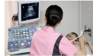
助産師外来で妊婦検診する助産師

また、合併症妊娠と産科救急については、この限りではありませんので随時対応させていただきます。