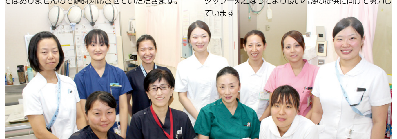
私たち助産師が健やかなお産に寄り添います

時代に合わせたケアや助産師外来の対応について、スタッフ一丸となってより良い看護の提供に向けて努力しています！