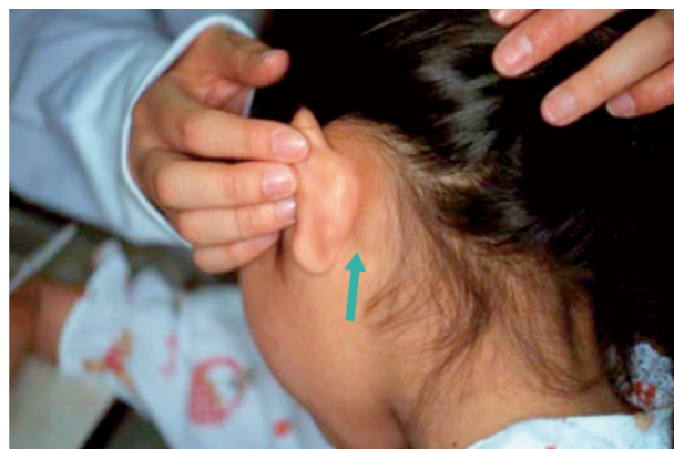
写真 2. 耳介後部リンパ節の腫脹が見られる（厚生労働省ホームページより）