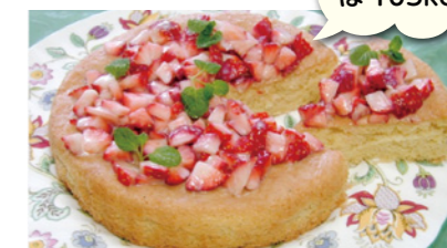
ゼロカロリーの甘味料を使った「苺とホワイトチョコレートのケーキ」