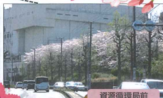
資源循環局前 (八丁目)