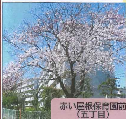
赤い屋根保育園前 (五丁目)