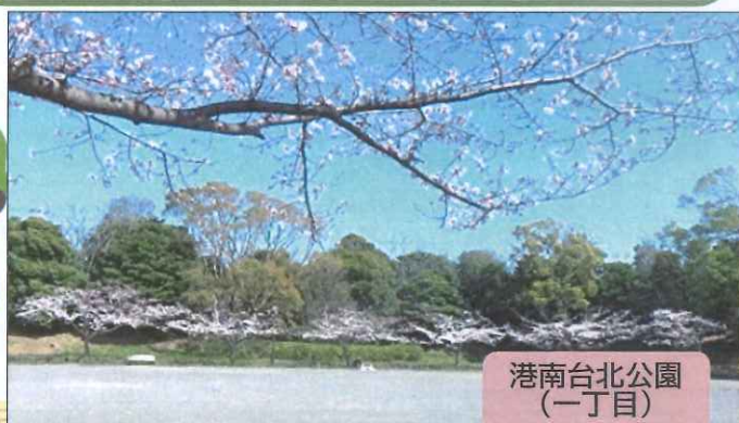
港南台北公園 (一丁目)