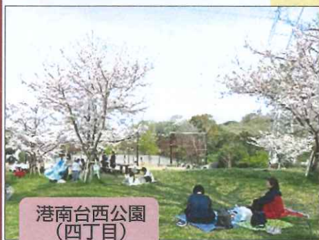
港南台西公園 (四丁目)