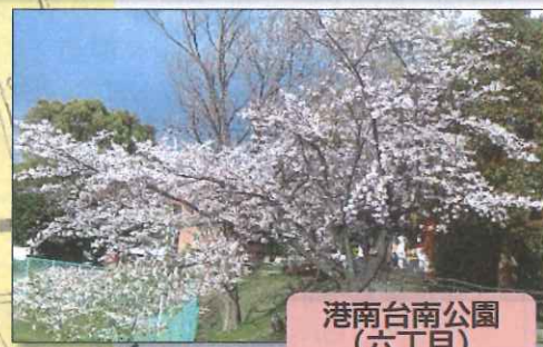
港南台南公園 (六丁目)